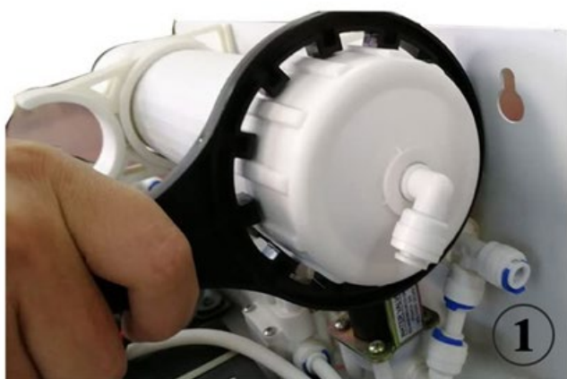
Rimuovere il tubo dal raccordo e svitare il tappo dell'alloggiamento con la chiave.