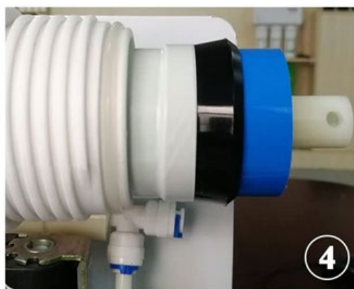
Riavvitare il tappo del contenitore -vessel e collegare il raccordo e il tubo.