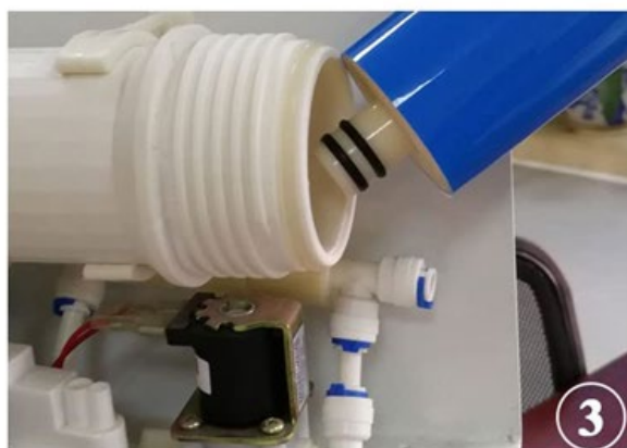
Inserire la nuova Membrana nell'alloggiamento come in figura.