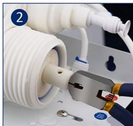
Togliere la vecchia membrana aiutandosi con una pinza.